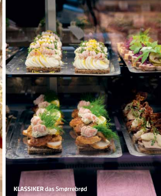
KLASSIKER das Smørrebrød