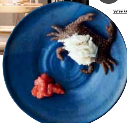
NOMA für Nordic Cuisine vom Feinsten