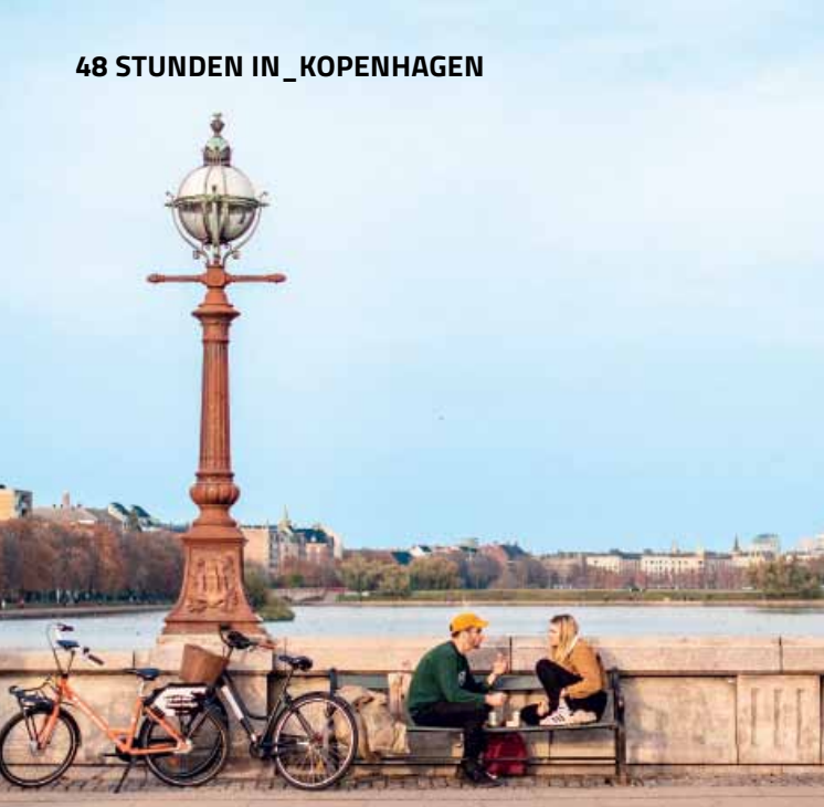
STADT DER BRÜCKEN In Kopenhagen soll es rund eintausend davon geben.