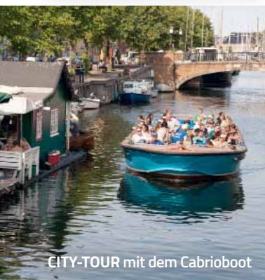
CITY-TOUR mit dem Cabriboot