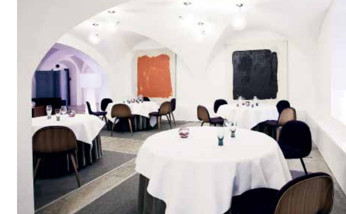
AOC die Adresse für Kunst und Kulinarik

20:00 Fürs kleinere Budget ist Selma der richtige Ort, um aufregende skandinavische Küche zu genießen. Grand Cuisine serviert indes das Zwei-Sterne-Restaurant AOC . www.selmacopenhagen.dk , www.restaurantaoc.dk