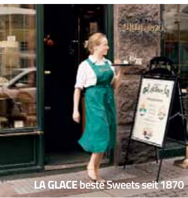
LA GLACE beste Sweets seit 1870