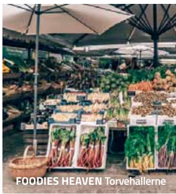
FOODIES HEAVEN Torvehallerne