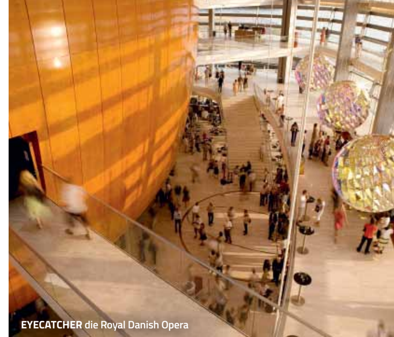
EYECATCHER die Royal Danish Opera