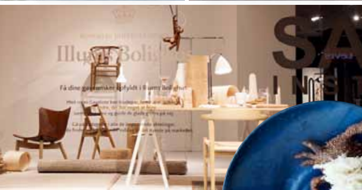
NOBELKAUFHAUS Illums Bolighus